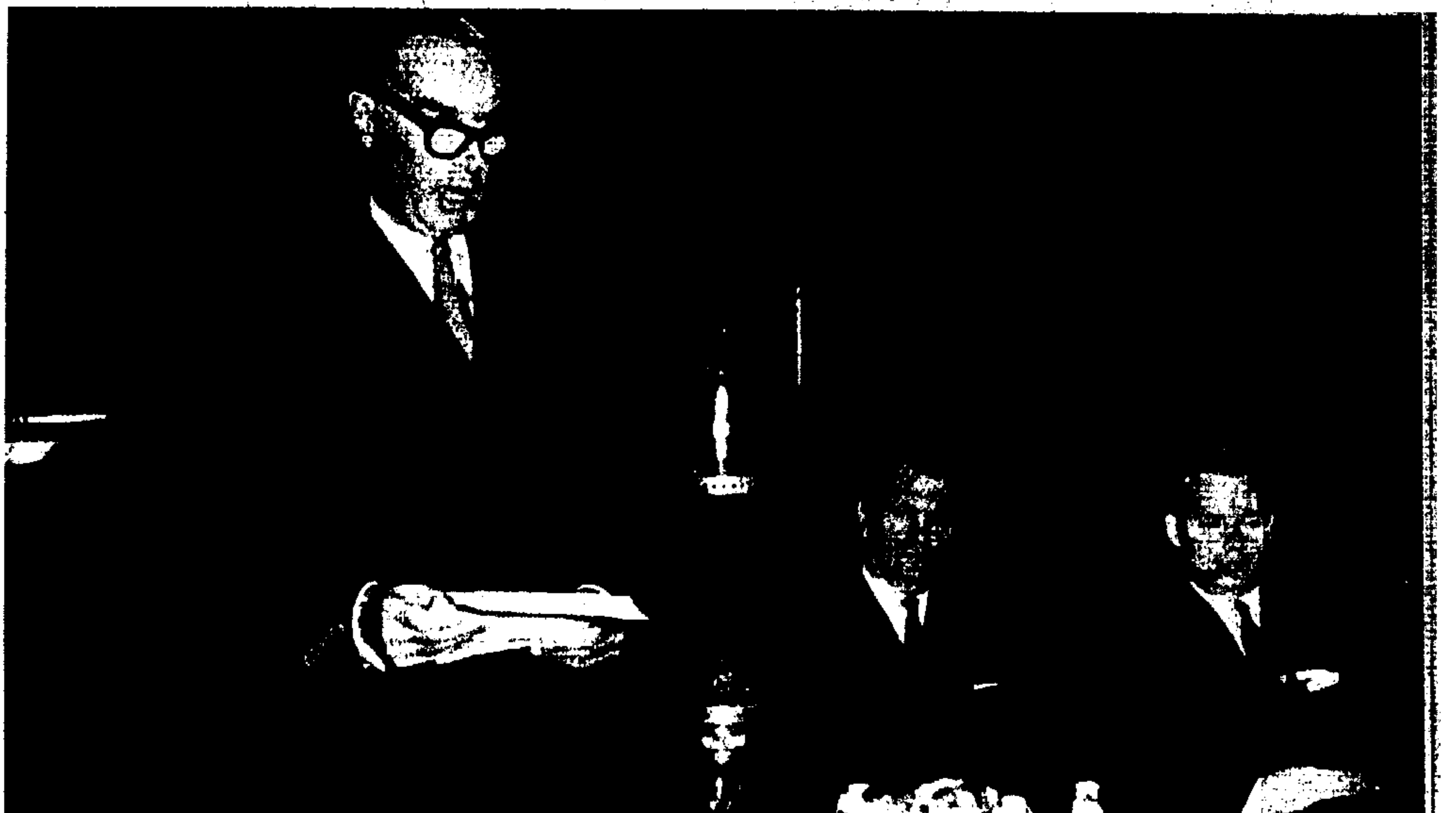
Bodenhause professzor beszél a szimpozion ünnepélyes megnyitóján